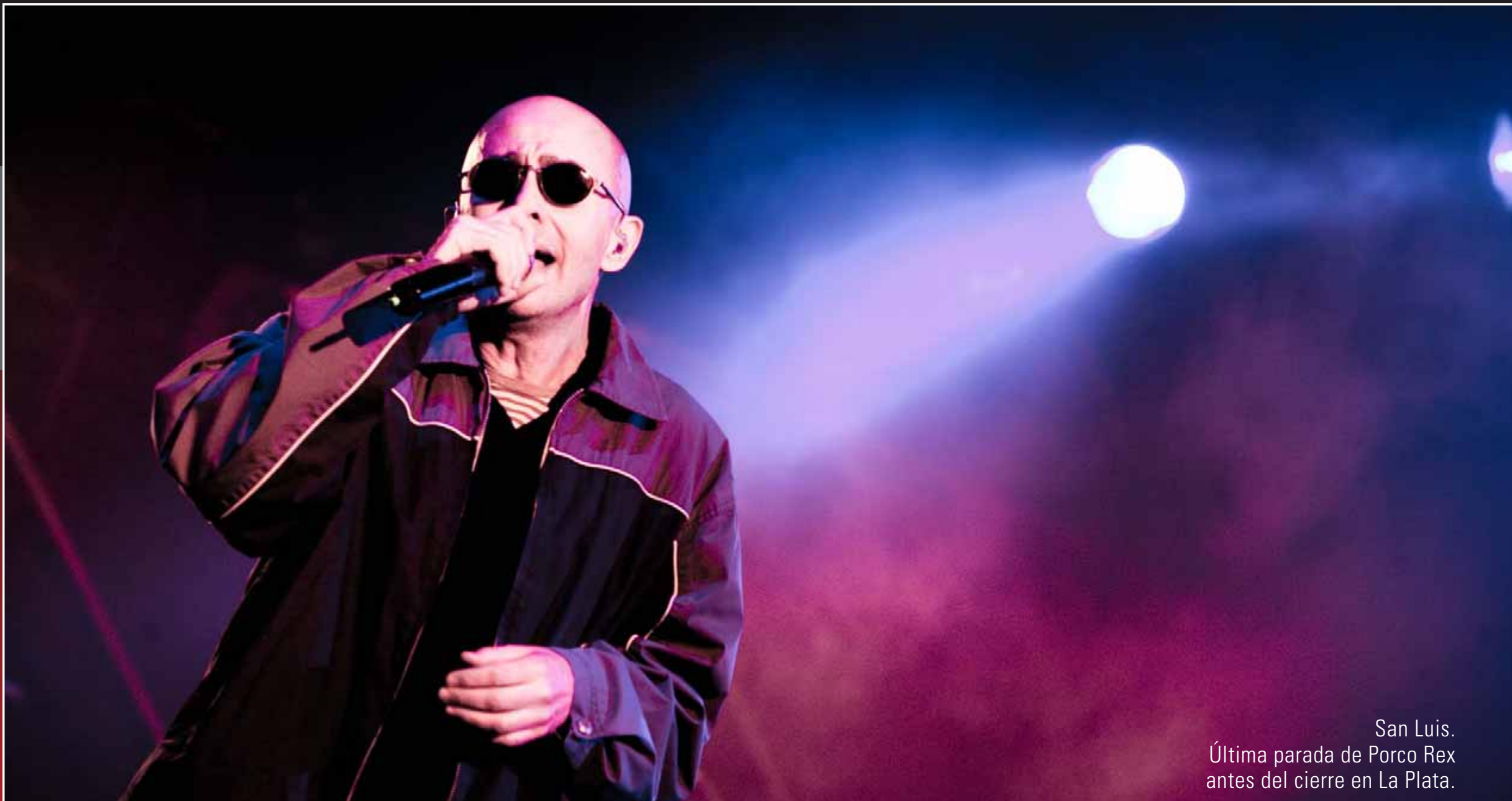
San Luis. Última parada de Porco Rex antes del cierre en La Plata.

tiva cuando uno ve las estadísticas internacionales se da cuenta que están en relación directísima (recalca ésta palabra) con el derrame del PBI (producto bruto interno).