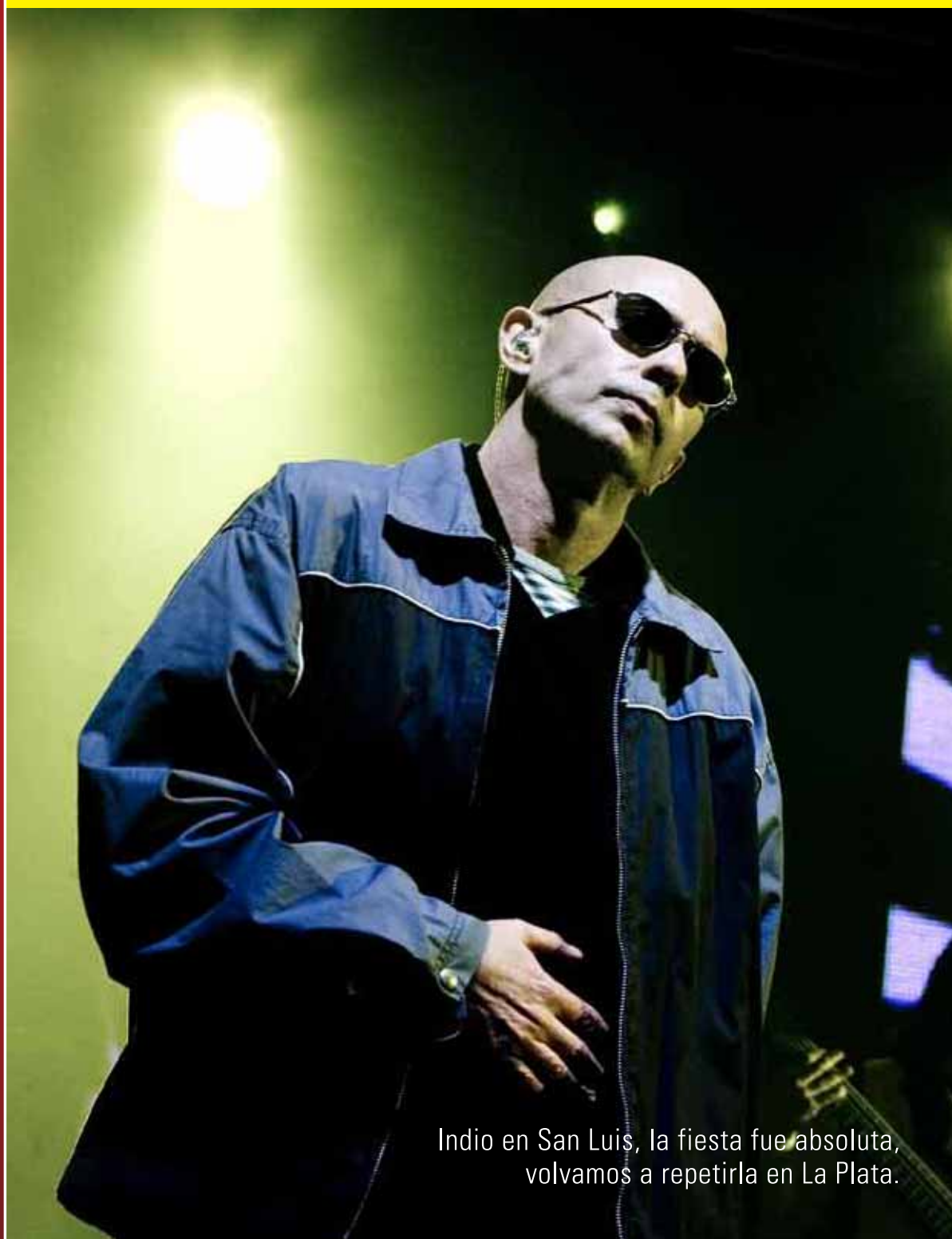
Indio en San Luis, la fiesta fue absoluta, volvamos a repetirla en La Plata.